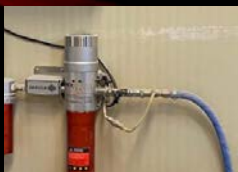
Incluye manguera de aire atemperada para un máximo aprovechamiento energético.

ZONA DE CALOR... EN TU CABINA. LA TEMPERATURA IDEAL PARA TU AIRE COMPRIMIDO