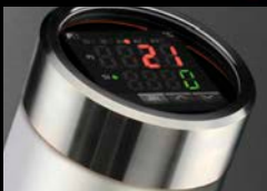
Control electrónico de la temperatura

Proceso de pintado estable en zonas con grandes cambios de temperatura entre noche-día, invierno y verano. Mejora del estiramiento de los barnices. Relé de estado sólido. Controlador de Temperatura P.I.D.