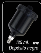
125 ml. ** Depósito negro

* Depósito de 650 ml. de capacidad. ** Depósito negro de 125 ml. ultravioleta