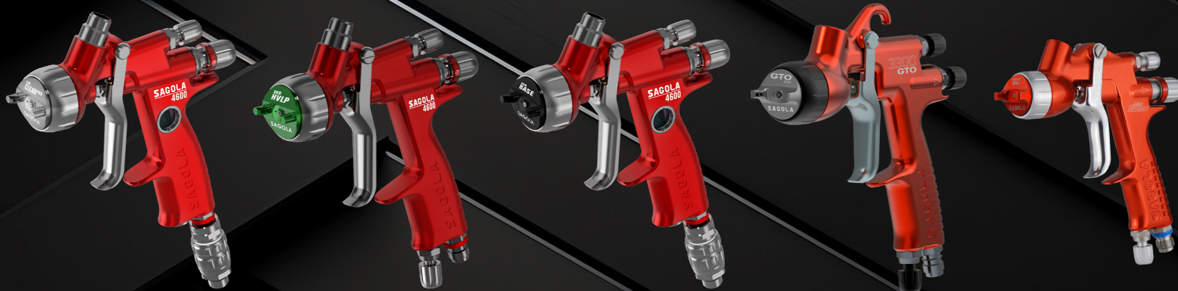
DVR CLEAR PRO SAGOLA 4600